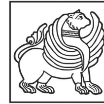
საქართველოს კულტურისა და კინოთა დაცვის სამინისტრო