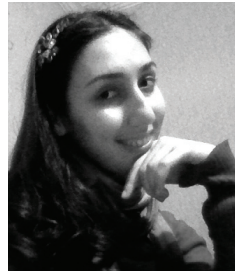
შორენა მეტრეველი საქართველო Shorena Metreveli Georgia