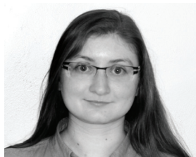
სოფი თერონი საფრანგეთი Sophie Théron France